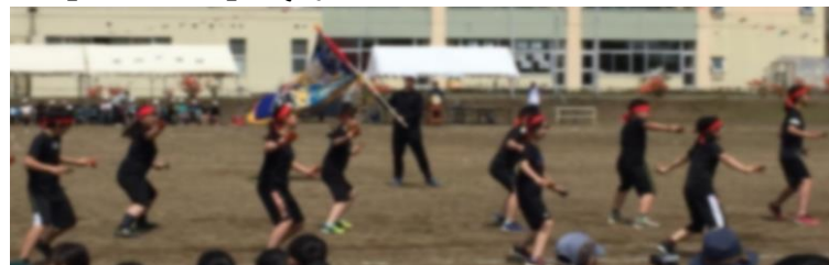
【よさこい】気迫と力強さが伝わってきました。