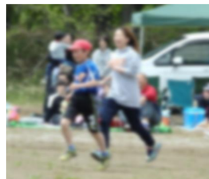
【借り人】和やかな雰囲気でした。