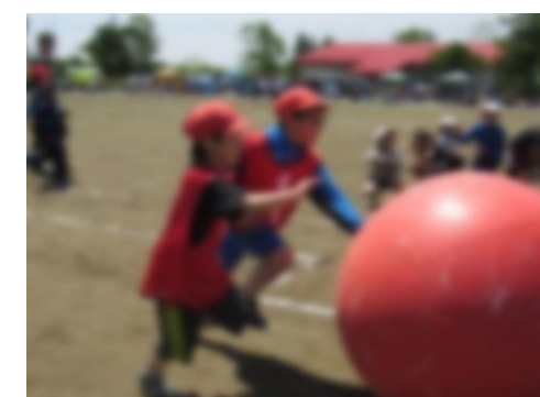
【大玉】最後の最後で大逆転！