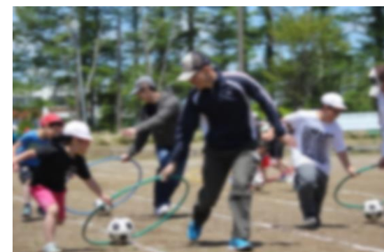
【親子】自然と笑顔があふれていました。