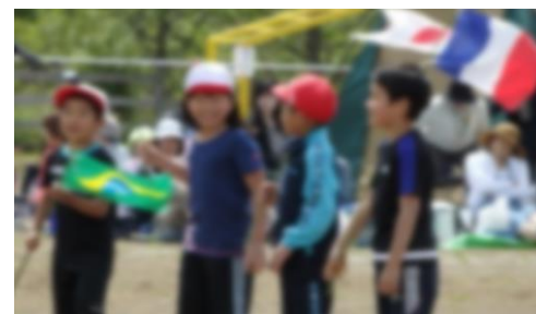
「優勝するのはどこですか？」