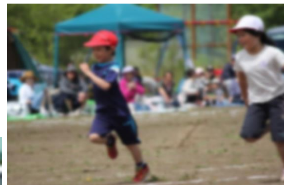
【かけっこ】1年生も元気よく走りました。

今年は、晴れました！全種目を実施することができました。約1ヶ月にわたって取り組んできたことの全てを出し切った子どもたちの姿は、とても輝いていました。「全力」「協力」が種目の中でたくさん見られました。また、運動会を支える仕事で頑張る子どもたちの姿もたくさんありました。また、PTA種目にもたくさんの方々に参加していただき、大変盛り上がりました。ご協力ありがとうございました。