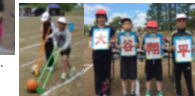
【二刀流】2本のスティックで転がすのは難しい。