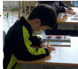
絵を描くこともいいですね。