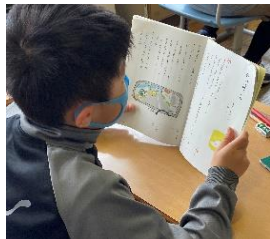
音読はしていますか？

今年も児童会活動がスタートしました。学校長から事務局、委員長、学級代表に「任命証」が授与されました。一人一人がキラリと輝くことができる学校になるようそれぞれの役割をしっかりと果たすとともに、友だちの仕事もカバーできるような優しさが育まれるよう教職員一同で児童会活動を支えています。