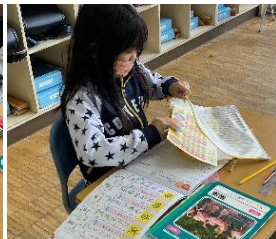
漢字学習していますか？