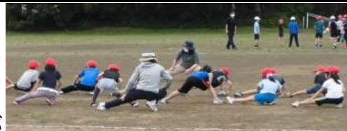
学級ごとに準備体操をしっかりとします

例年は土曜授業に実施しコースの安全確保を保護者の皆様をお願いしていましたが、今年は、新型コロナウイルス拡大防止のため、日常の体育科の学習の中で開催します。また、道道工事の影響も踏まえ、コースも大きく変更しました。グラウンドと学校のまわりをコースにし、安全確保をしやすいするとともに、子供たちが自主的に練習しやすくなりました。