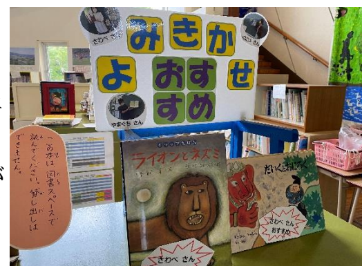
手に取りやすいように工夫をしています