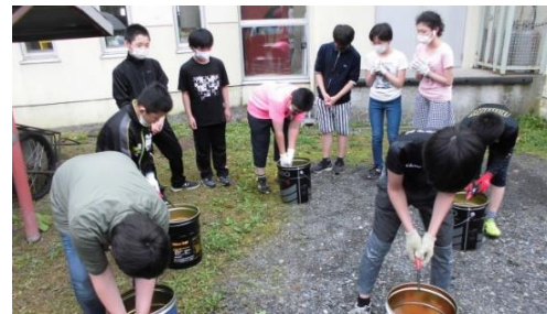
6年生が代表して祈りながら炊き上げました