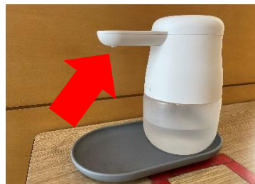
手を下にかざすと自動で適量の消毒液が噴霧されます