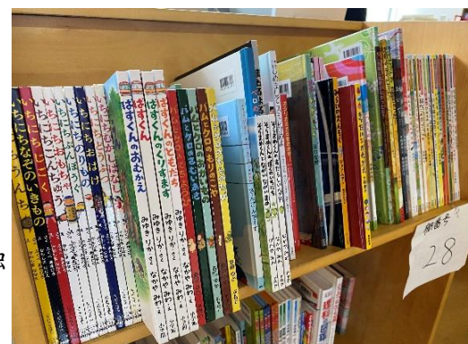
新刊146冊が新刊コーナーにあります