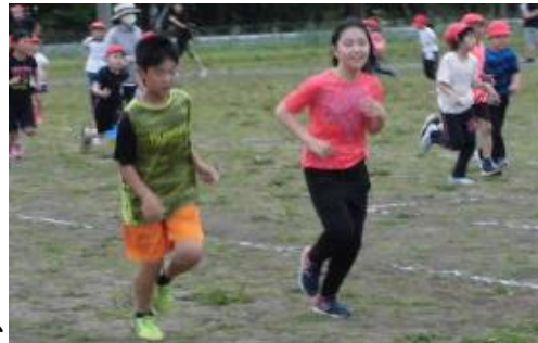
自分のペースで長い時間を走る力を高めます