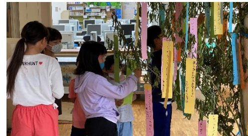
休み時間にお互いにお礼を見合いました