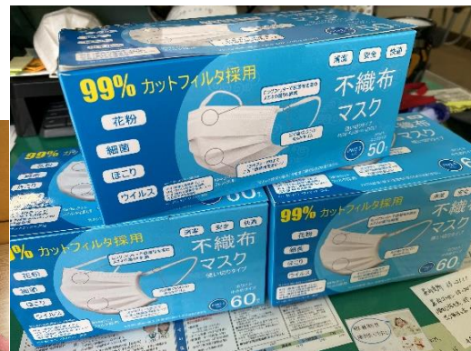
地域の方からマスクの寄贈がありました。小学生サイズの入手が難しく、助かりました