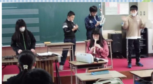
12/9 6年生：アンサンブル発表会