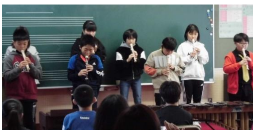
12/2 5年生：音楽発表会（ルパン、ゴジラ）