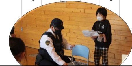
12/7 2年生がおもちゃ大会に地域の方と1年生を招待しました。