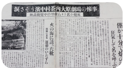
■全国に悲劇が伝えられた