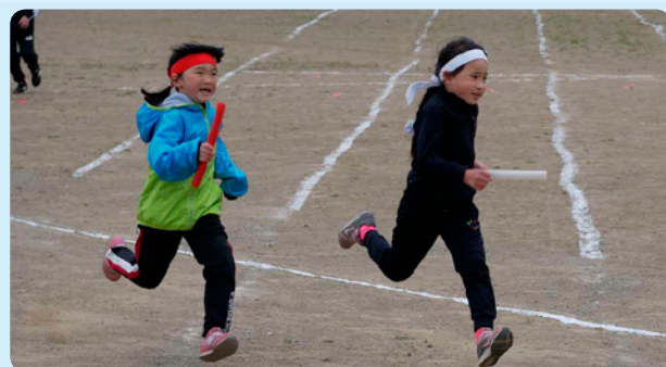
6月11日 茶内小学校 真剣勝負 ～最後まで一生懸命やろう～