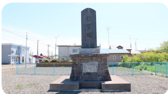
■犠牲者の名前が刻まれた慰霊塔