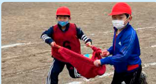
6月11日 霧多布小学校 全力で仲間と協力し、 楽しく笑顔あふれる運動会にしよう！