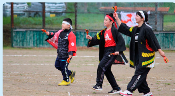
6月6日 散布小中学校(散布保育所合同) はじけるスマイルで輝いちゃって^_^ ～みんなのパワーで成功させよう～

なお、7月9日(土)には、霧多布中学校、浜中中学校、茶内中学校で校内陸上大会や体育大会が開催されます。子どもたちの頑張りに大きな拍手をお願いします。