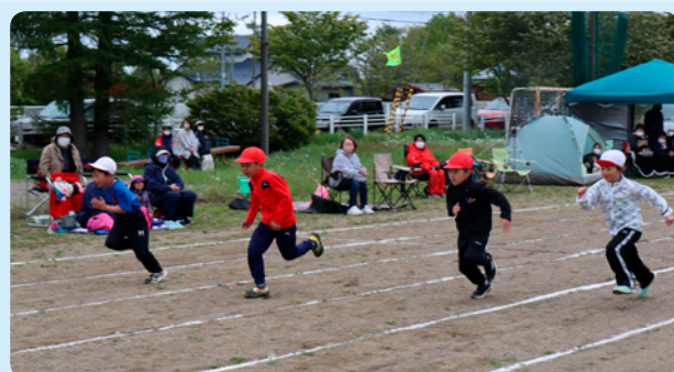
6月5日 浜中小学校(浜中・姉別保育所合同) だ～だれもが し～しゅやく き～きもちを一つに れ～れんしゅうの成果を！