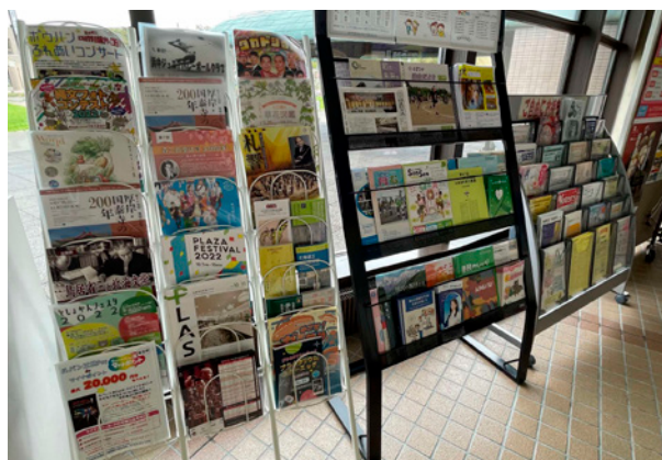
一番手前の縦長の白いラックに、美術館や博物館の企画展のチラシが入っています。