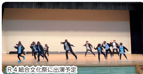
R4 総合文化祭に出演予定