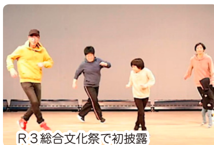
R3 総合文化祭で初披露