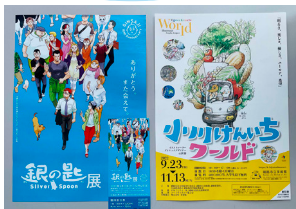
チラシのほかに割引券が入っていることがあります。(右側はチラシと一体型の割引券です)

なお、このような割引券は、各施設から送られてくる数量限定のもので、なくなり次第終了であることは、ご了承ください。