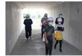
防災避難道路見学