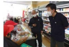
スーパー丸ヨ見学