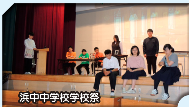
浜中中学校学校祭