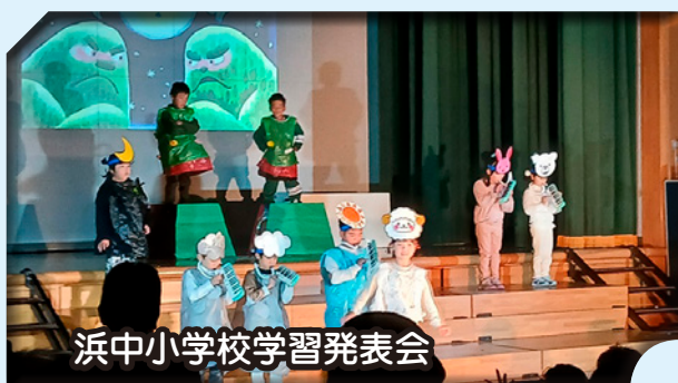
浜中小学校学習発表会