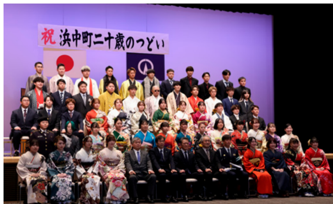
写真は昨年の式典です

令和8年浜中町「二十歳のつどい」は、1月11日(日)13時30分から挙行されます。