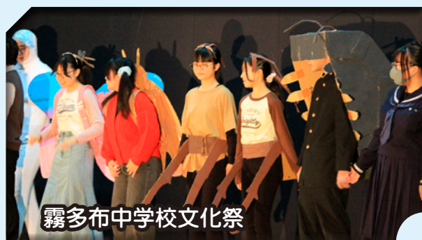
霧多布中学校文化祭