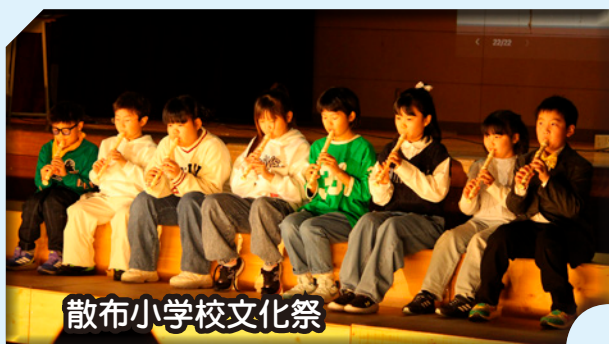
散布小学校文化祭