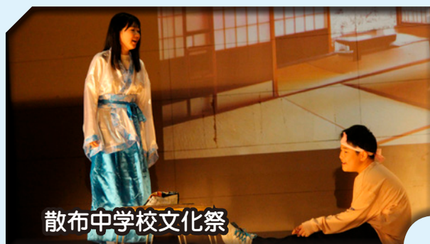
散布中学校文化祭