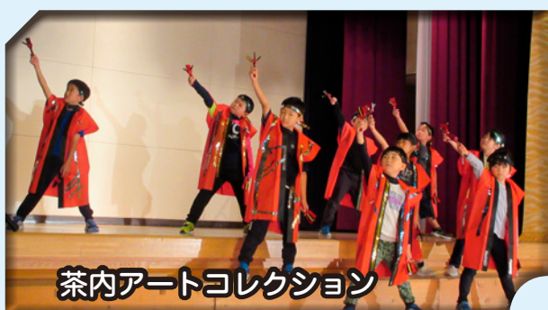
茶内アートコレクション