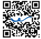
ウニツアー 予約フォーム

今年も大人気のウニツアーの時期がやってきました。今年は浜中町ウニ種苗生産センターと霧多布水産加工場を見学します！（天候等により見学できない場合もあります）ウニの種苗が生産されてから製品になるまでの過程を学び、最後は贅沢にウニを8個使ったウニ丼を作って実食！ウニ尽くしのひと時を楽しめます。なお、ウニツアーは3月まで行います。町民の皆さまのご参加も大歓迎！お申し込みは電話、またはQRコードからお願いします。