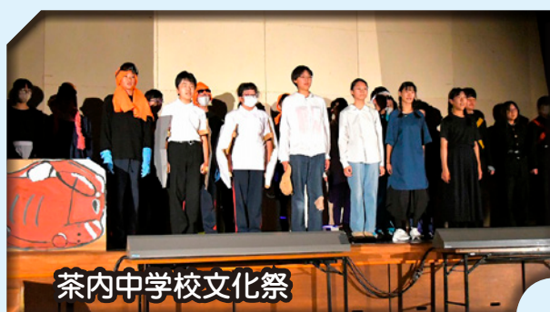
茶内中学校文化祭