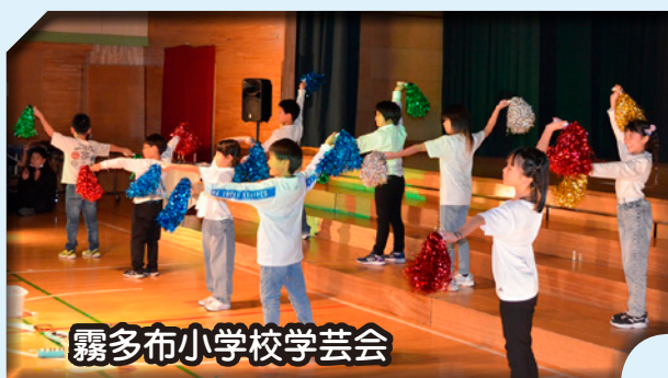
霧多布小学校学芸会

秋の深まりとともに、町内の小中学校で学芸会や文化祭が開催されました。児童生徒たちはこれまでの学習や練習の成果を、舞台発表や作品展示を通して堂々と披露しました。歌や劇、器楽演奏、創作作品など、どの発表にも子どもたちの個性とチームワークが光り、観客の心を引きつけました。保護者や地域の皆さんの温かい拍手に包まれながら、子どもたちの成長を感じる感動の時間となりました。