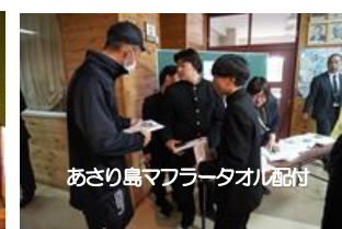
あさり島マフラータオル配付