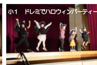
小1 ドレミでハロウィンパーティー