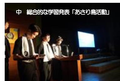
中 総合的な学習発表「あさり島活動」