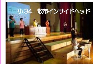
小34 散布インサイドヘッド