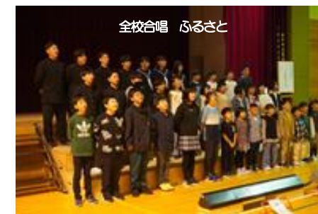
全校合唱 ふるさと